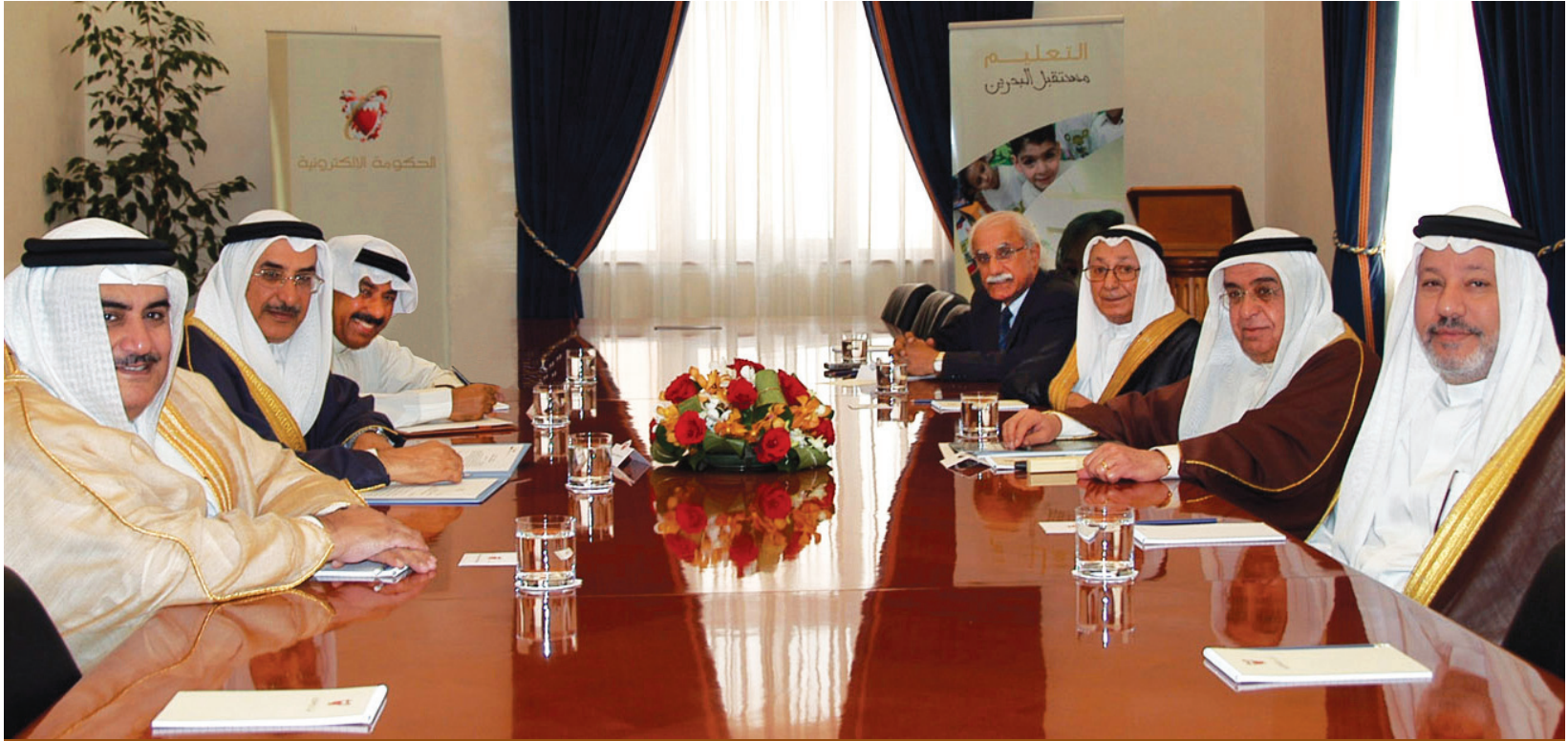
مجلس أمناء جائزة عيسى لخدمة الإنسانية